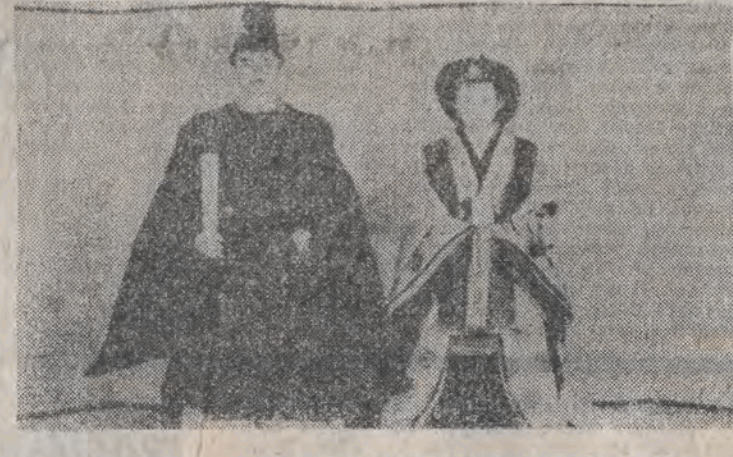
W pałacu cesarskim w Tokio odbył się ślub młodszego syna cesarza, księcia Aji, ze studentką Kiko A. Kawashima.

PAN DOZORCA Nazywa się wyciecznicą: dozorca, a pełni faktycznie rolę autentycznego gospodarza — ule tylko