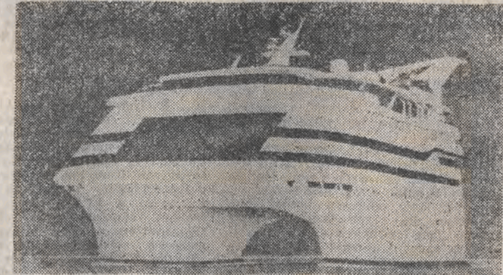
W stołeczki helskiej rozpoczęto budowę dwukadłubowego statku pasażerskiego o wyporności 18.000 ton i pojemności 354 pasażerów. Ten nowoczesny statek obsługiwać będzie linia karabska. N.z. artystyczna wizja statku.

Urażeń w swej dumie Brytyjczycy nie zamierzają jednak oddać pierwszego miejsca bez walki. Dziś statystyczny mieszkaniec Albionu wypija dziennie 3 filiżanki herbaty. Wszyscy razem płaca za to ponad miliard dolarów. Interes dla azjatyckich plantatorów i europejskich kupców jest więc niesłychanie intratny. „Nie powiedzieliśmy ostatniego słowa — oznajmili po publikacji cytowanych na wstępie danych — naszym celem jest nakłonienie Anglików, by sięgnęli po czwartą filiżankę”. Rosjan przynajmniej nie będzie już na nią stać.