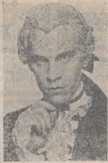
Hamptona. Przypomnijmy też, że w rok po premierze filmu Frearsa, Miłosz Forman zrealizował film "Valmont", a więc tytułowym bohaterem czyniąc jedną z dwu głównych postaci "Niebezpiecznych związków".

W dwu gotowniach odbywa się misterium ubierania. Na nią nakładają kolejne konstrukcje podkreślające kształt sylwetki i linie sukni. Jego twarz, właśnie przystojnie specjalna maska, by upudrować perukę... Malowniczy obrazek. Pierwszy z licznych wizerunków epoki jakie zawiera "NIEBEZPIECZNE ZWIĄZKI" reż. Stephena Frearsa.