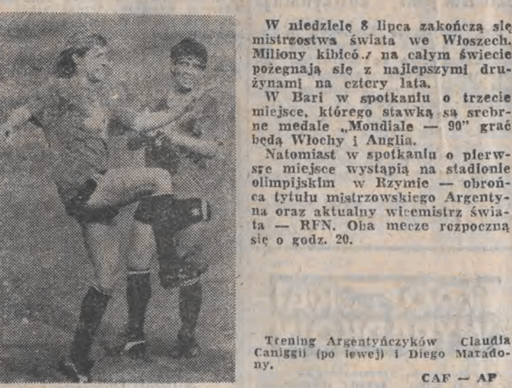
Trening Argentczyków Claudia Caniggli (po lewej) i Diego Maradony.

W niedzielę 8 lipca zakończy się mistrzostwa świata we Włoszech. Miliony kibiców na całym świecie połączą się z najlepszymi drużynami na cztery lata. W Bari w spotkaniu o trzecie miejsce, którego stawką są srebrne medale „Mondiale — 90” grać będą Włochy i Anglia. Natomiast w spotkaniu o pierwsze miejsce wystąpią na stadionie olimpijskim w Rzymie — obrońca tytułu mistrzowskiego Argentyna oraz aktualny wicemistrz świata — RFN. Oba mecze rozpoczną się o godz. 20.