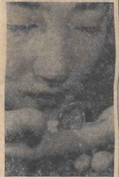
Ten ponad 104-karatowy diament „Deeptene” jest uważany za jeden z pięciu największych diamentów na świecie.

Premier Mazowiecki podkreślił, że zaproszenie stoczniovców przyjął z przyjemnością. Mam nadzieję — powiedział — że będzie to rzeczowa rozmowa, w której zostanie przedstawiony z jednej strony związkowy punkt widzenia, a z drugiej rządowy mówiący o możliwościach kraju. Nie przyjąłem zaproszenia do stoczni na 8 bm. — wyjaśnił T.