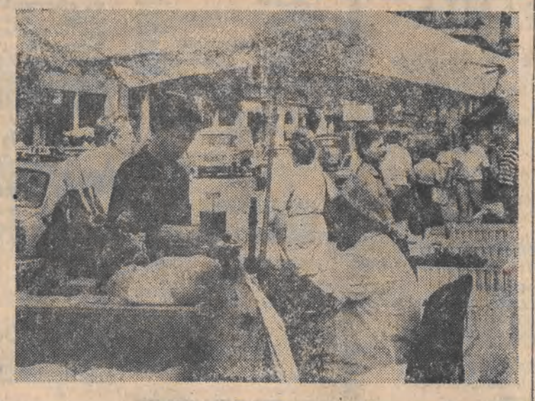
Na upały najlepsze są „babełki”.