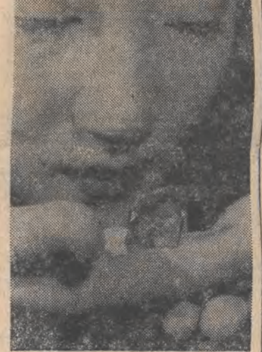
Ten ponad 104-karatowy diament „Deeptene” jest uważany za jeden z pięciu największych diamentów na świecie.

Przywódcy siedmiu najbardziej uprzemysłowionych krajów świata po krótkim roboczym posiedzeniu w środę rano, wcześniej niż planowano, zakończyli spotkanie na szczycie w Houston, osiągając porozumienie we wszystkich spornych kwestiach, m.in. w sprawie subsydiów dla rolnictwa — jak podają źródła francuskie.