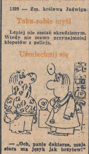
— „Och, panie doktorze, moja stara ma język jak brytyw!”

Dziś mamy wtorek, 17 lipca. Imieniny obchodzą Aleksy, Bogdan, Dzierżykraja, Jadwiga, Ruslan Dziurny synoptyk w dniu dzisiejszym przewiduje dla Łodzi następującą pogodę: zachmurzenie małe i umiarkowane. W godz. popołudniowych możliwość wystąpienia przelotnego opadu. Temp. maks. w dzień 22 st. Wiatr umiarkowany i dość silny, zachodni. Cisnienie o godz. 19 wyniosło 991,2 hPa (743,4 mm), a temp. 24,1 st. Z kalendarza wydarzeń 1399 — Zm. królowa Jadwiga Taka-sobie myśl Lepiej nie zostać okradzionym. Wtedy nie mamy przynajmniej kłopotów z policją. Uśmiechnij się