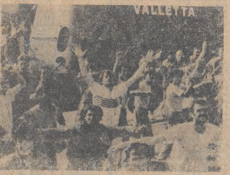
Do Warszawy przybyli uchodźcy z Albanii. Przywiozł ich z Brindisi w „Włazie” kapitan „Orient Star”.

Kancelarz RFN Helmut Kohl, występując w poniedziałek wspólnie z Michaiłem Gorbaczowem na konferencji prasowej w Zelenowodsku na Kaukazie oświadczył, że wojska radzieckie zostaną wycofane z terytorium NRD w ciągu 3-4 lat od zawarcia dwustronnego układu między ZSRR a zjednoczonymi Niemcami. Kohl i Gorbaczow zakończyli w poniedziałek w Zelenowodsku serię rozmów, których przedmiotem były problemy związane ze zjednoczeniem Niemiec. Konferencja prasowa, na której wystąpili wspólnie, była bezpośrednio transmitowana przez telewizję radziecką. Kancelarz RFN polecał, że z radzieckim przywódcą porozumiał się co do tego, iż przyszłe zjednoczone Niemcy same zdecydują, czy i do jakiego sojuszu