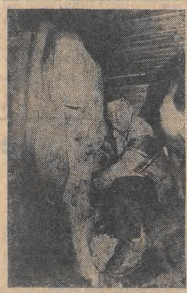
Do tradycji należą już odwiedzać członków szwajcarskiego rządu w rodzinnej miejscowości prezydenta kraju. Okazało się, że prezydent, profesor ekonomii Arnold Koller umie doć krowy.

Polska potrzebuje silnej armii. Naród potrzebuje wernego mu żołnierza. Państwo musi posiadać stabilny filar swej władzy — powiedział premier Tadeusz Mazowiecki wczoraj na spotkaniu z kierowniczą kadrą Wojska Polskiego. W spotkaniu uczestniczyli członkowie kierownictwa MON, szefowie instytucji centralnych, dowódcy okręgów wojskowych, rodzajów sił zbrojnych i związków taktycznych. (PAP)