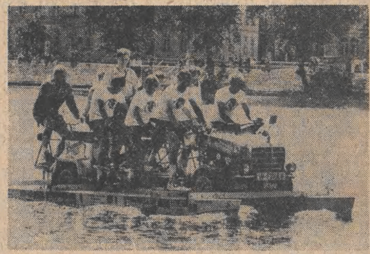
Ten 8-osobowy pojazd, który pływa po jeziorze Pfaffenweih, Szwajcarii (NRD), może poruszać się także po drodze.