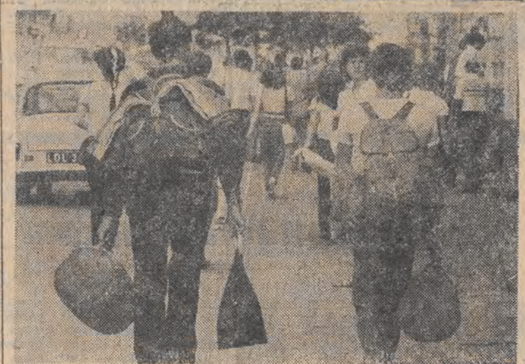
Na wakacje najtaniej z plecakiem, spiworem i... siatką na zakupy.