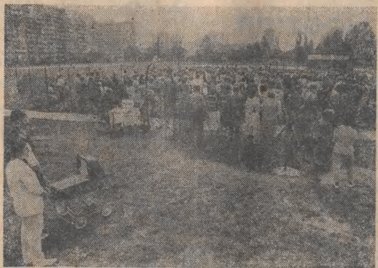
12 tys. wiernych z nowej parafii pod wezwaniem św. Łukasza przy ul. Strycharzkiej czeka na wybudowanie własnej świątyni. Na razie nabożeństwa muszą odbywać się w takich warunkach.

Papież wezwał młodzież do rozpoczęcia już teraz duchowych przygotowań do przypadającego na 15 sierpnia przyszłego roku szóstego Światowego Dnia Młodości i do pielgrzymki do Częstochowy. Będzie to niezapomniane spotkanie młodego Kościoła Wschodu i Zachodu — powiedział papież Jan Paweł II.