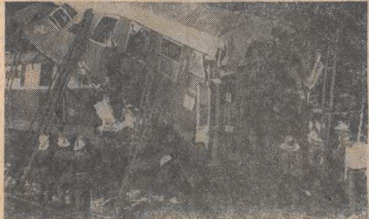
Na zdjęciu: miejsce katastrofy.