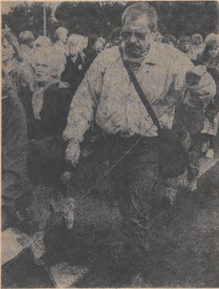
W drodze na Jasną Górę