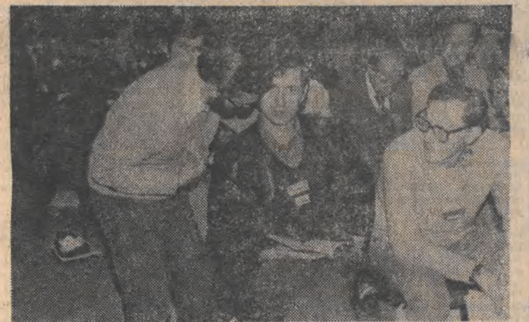
Jedna z historycznych już fotografii, które będzie można oglądać na wystawie „Solidarność” przygotowywanej w MPK przy ul. Traugottowej 8. Uroczyste otwarcie w niedzielę o godz. 12.

ce się w drugim oblegu, plakaty i fotografie. Ekspozycja prezentuje też kalendarium zdarzeń. Wystawa czynna będzie do końca września w godzinach otwarcia biblioteki.