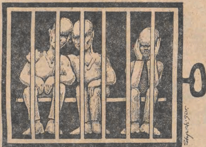
Rys. Piotr Zdrzyński

— Ja byłem narkomanem — mówi drugi. — W Gdańsku tylko raz mnie badali i pobrali centymetr krwi. Innym biorą 3-4 cm. Służba więzienna i inni więźniowie czują do nas respekt. Jest psychozą przed HIV — w Gdańsku, gdy nas prowadzili przez korytarz, zamykali się wszystkie drzwi. Nawet nie doprowadzili mnie na sprawę żony, bo się bał. Nie mam gdzie wracać, nie wiem, jak przyjmie mnie rodzina. Na wolności będę miał emblemat HIV.