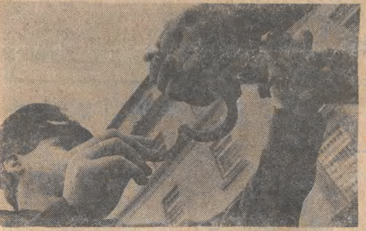
„Przysposobienie do życia w kryminale” — reportaż z łódzkich zakładów karnych, czytaj na str. 3.

Urządzący sekretarz stanu USA Lawrence Eagleburger oświadczył w piątek, że pomimo zaangażowania się Stanów Zjednoczonych w poważny konflikt w strofiej Zatoki Perskiej, rząd USA utrzyma