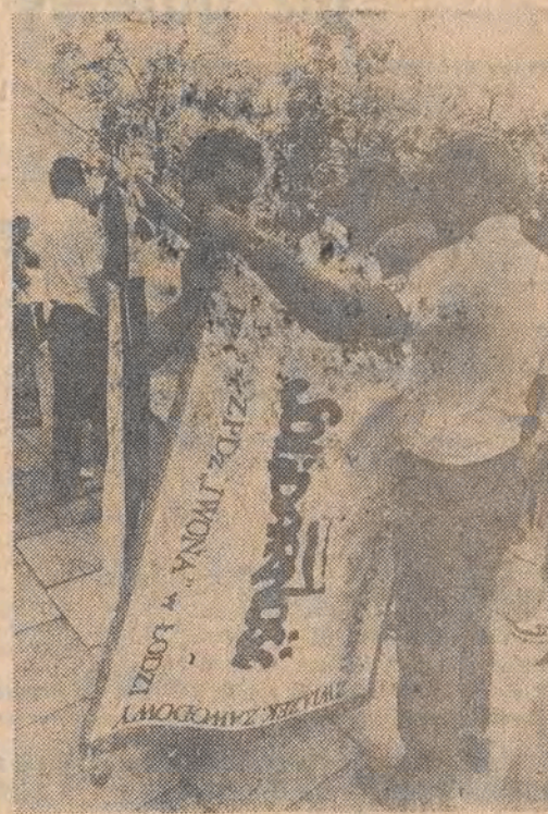
Palke. Złożenie kwiatów pod tablicą pa- ul. Kraszewskiego zakończyło uroczystości.