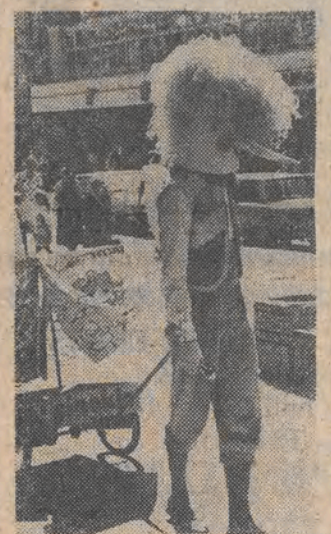
Ostatnio nie tylko handel wychodzi na ulicę. „Pikokio” też!

A przecież tuż obok jest hala, która po modernizacji przypomina — jak mówią — Europę. Tylko tyle że do tej skurat Europy spieszy się nielicznym.