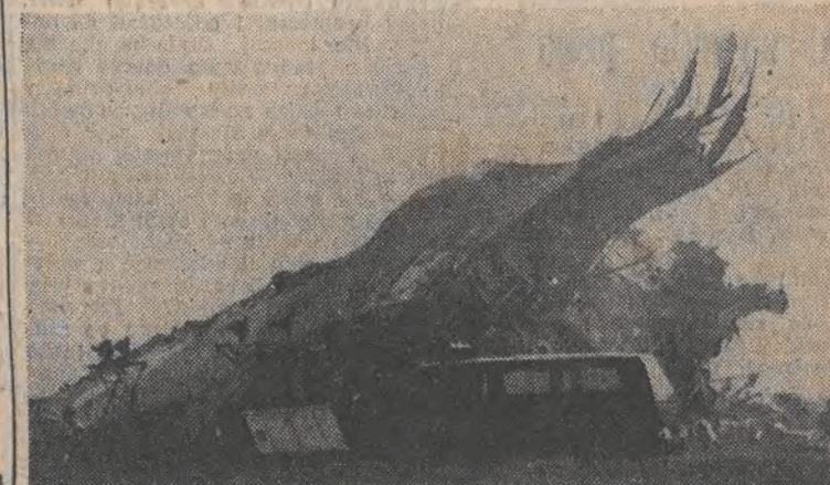
Szczątki amerykańskiego transportowca, który rozbił się po starciu z bazy Ramstein w RFN w drodze nad Zatokę Perską. Zginęło 11 osób, 5 jest rannych.

— Kuratorium ma plan likwidacji zespołów administracyjnych i (DALSZY CIĄG NA STR. 4)