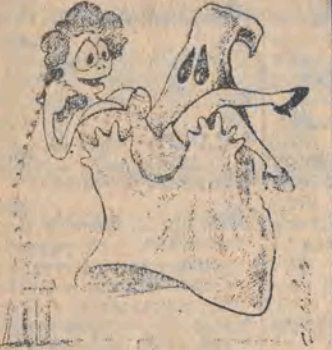
(rys. Piotr Zdrzwicki)