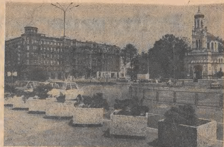
Łódź. Skrzyżowanie ul. Kilińskiego i Narutowicza.