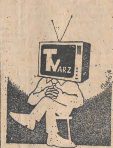
Rys. Piotr Zdraynicki

8.00 Panorama dnia. 8.10 Ulica Sezamkowa - pr. dla dzieci. 8.10 Saints Barbara (41) - ser. prod. USA. 10.00 CNN - Headline News (wersja oryginalna). 10.15 Magazyn telewizji śniadaniowej. 11.00 Retransmisja obrad Senatu. 12.00 Powitanie. 15.10 Dookoła świata - w górach Taj-Szan. 15.40 Z wiatrem i pod wiatr - magazyn żeglarski. 16.00 Kontakt TV - w kontakcie ze światem: Czerwona mafia. 17.00 Historia Hollywood (10-ost.) - Hollywood dzisiaj - ser. dok. 18.00 Łódzkie Wiadomości Dnia (Ł). 18.30 Modlitwa wieczorna z Tarnowa. 18.50 Propozycje Dwójki. 19.00 Hipoteza - nowela TP: reż. K. Zanusi. 19.30 Studio festiwalowe: Wratislavia Cantans. 20.00 Non stop kolor - magazyn. 21.00 Wywiady Ireny Dziedzic. 21.30 Panorama dnia. 21.45 Sport. 21.55 Romeo i Julia z Saskiej Kępy - film fab. - reż. Edward Skórzyński - wykł. Krzysztof Chamiel, Barbara Zielińska, Gustaw Lutkiewicz. 23.30 Studio sport - superliga tenisa stołowego Polska - RFN. 24.00 Komentarz dnia.