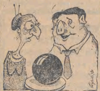
rys. Piotr Zdrzyński