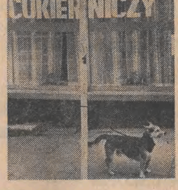
Wolałbym czekać przed mieszkaniem...