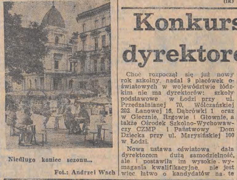
Niedługo koniec sezonu...

W Łodzi powołano Zarząd Okręgu Związku Legionistów Polskich - organizacji niepodległościowej, pilsudczykowskiej i kombatanckiej, prowadzącej działalność od 30 maja 1913 roku. Związek skupia przedstawicieli wszystkich pokoleń żołnierzy Rzeczypospolitej oraz ich rodziny. Siedziba zarządu okręgu znajduje się w Łódzkiej Domu Kultury (ul. Traugutta 18, p. 402). Członkowie zarządu dyżurować będą w czwartki w godz. 16-18, począwszy od 20 września. (ik)