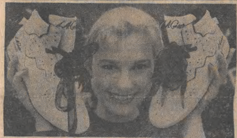
Te sportowe buty kosztują, bagatelka, 12.600 marek. Na tę fantastycznie wysoką cenę wpływa fakt, iż są one wyszywane... diamentami. Stanowią oczywiście atrakcję targów wyrobów sportowych w Monachium.

Temperatura maksymalna 19-25 st., minimalna 7-13 st. W pozostałych dniach września spadek temperatury maksymalnej do 15 st., a minimalnej do około 5 st. Opady.