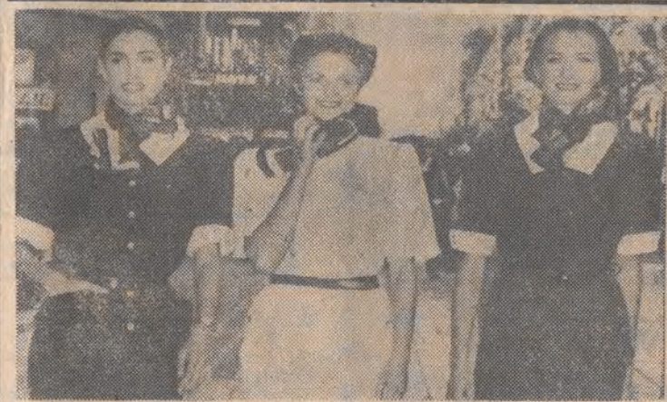
Stewardesy z wewnętrznych francuskich linii lotniczych Air-Inter zostały ostatnio ubrane w nowe uniformy zaprojektowane przez dom mody Niny Ricci.

Agencja TASS podała, że poziom promieniowania nie odbiega od normy. Kilka osób odniosło obrażenia, ale nikt nie uległ radioaktywnemu skażeniu. (PAP)