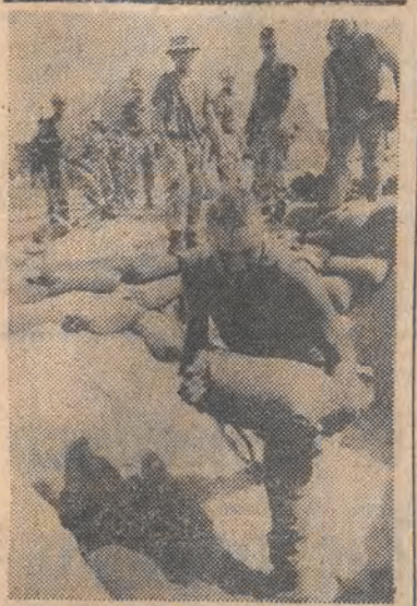
Stopy worków z piaskiem - to umocnienia jednego z posterunków amerykańskich marines na pustyni Arabii Saudyjskiej.