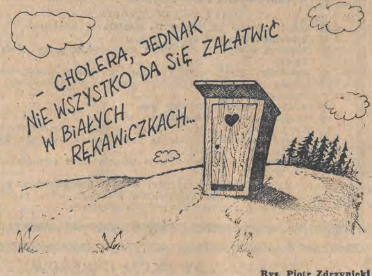
Rys. Piotr Zdrzyński

TADEUSZ ORDYŃSKI ul. Ghandiego 15 UWAGA! Publikujemy listy tylko tych autorów, którzy nie zastrzegają swoich danych do wiadomości redakcji.