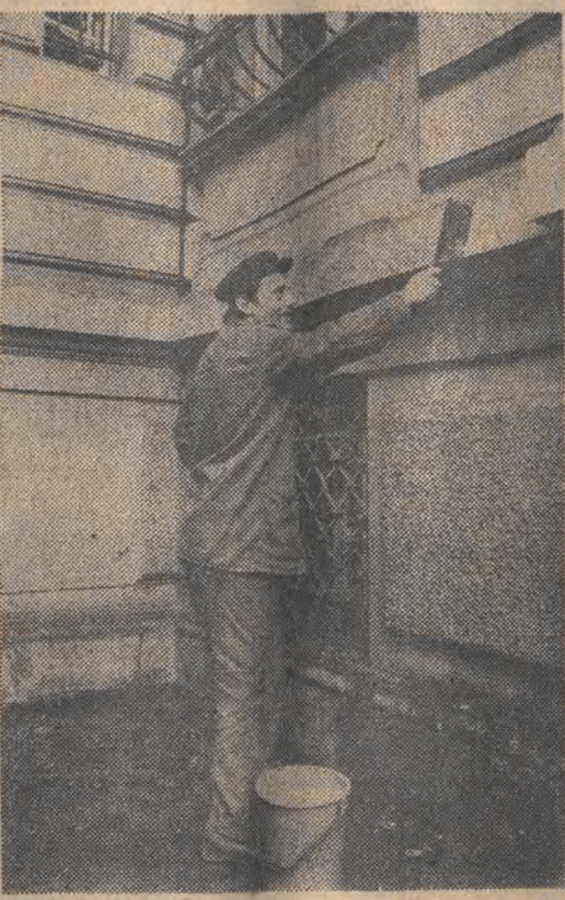
Przed wizytą królowej Hiszpanii, Zofii, nawet myśle się fronton Muzeum Sztuki.