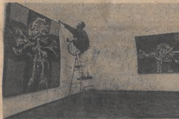
Przygotowanie ekspozycji prac hiszpańskich artystów w salach Muzeum Sztuki