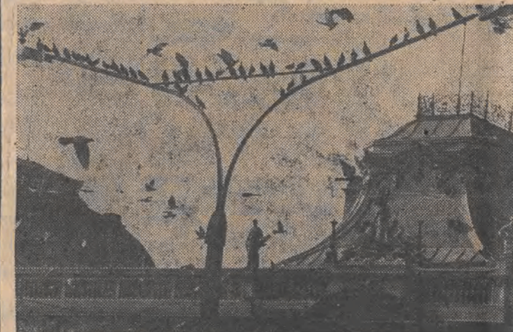
Nadeszła jesień — czas odlotów.

nia aż do odwołania pociągów z Krakowa do Bydgoszczy będzie kursował przez Łódź-Widzew i Zgierz z pominięciem stacji Łódź-Chojny i Łódź-Kaliska. Odjazd ze stacji Łódź-Widzew o godz. 3.40, ze Zgierza o 4.10. (j.h.)