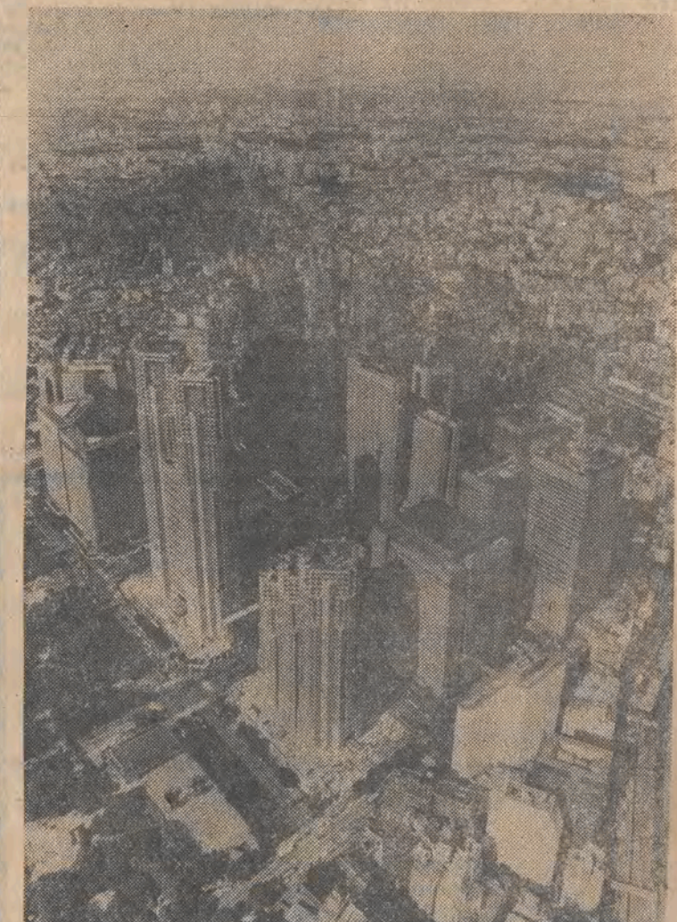
Wieżowce w handlowej dzielnicy Shinjuku w Tokio.