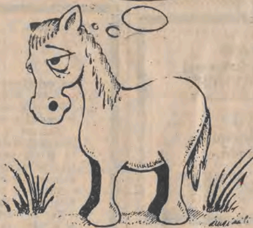
Rys. Piotr Zdrzyński