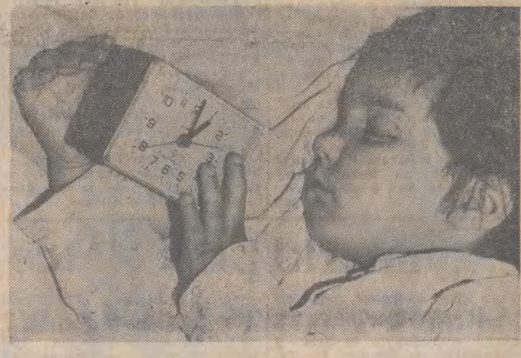
Z 29 na 30 bm. - powrót do czasu zimowego. Spiny więc o godzinę dłużej. CAF - M. Wegner

Nicu Ceausescu, syn byłego dyktatora Rumunii, skazany w ubiegłym tygodniu na 20 lat więzienia, zostanie zwolniony na 90 dni ze względu na stan zdrowia. Nicu Ceausescu cierpi na marskość wątroby. (PAP)