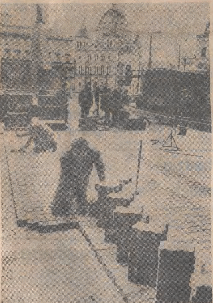
Pracownicy bydgoskiego PZ „POLBET” kończą układanie nowej kostki na pl. Wolności.

Minister pracy i polityki społecznej zmienił zarządzenie w sprawie najniższego wynagrodzenia pracowników Od 1 października wysokość najniższego wynagrodzenia wzrasta z 368 000 zł do 440 000 zł.