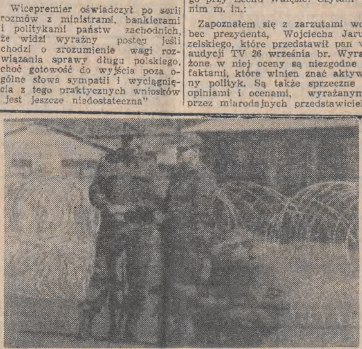
RPA. Zasiłki z drutu kolczastego wzniesione wokół hoteli robotniczych w Soweto oraz wzmocnione posterunki policji, powstrzymywały dalsze walki między czarnoskórymi zwolennikami ANC i Ikatha. Gabinet zatwierdził plan operacji dla położenia kresu walkom pleniennym.

Rozporządzenie w par. 2 przewiduje oświadczenie rolnika jedynie w odrozwinięciu przypadku, tzn. jeśli zapłacił więcej i chce przenieść nadwyżkę na poczet składki w przyszłym roku.