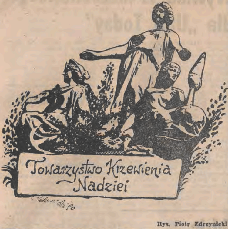
Rys. Piotr Zdrzyński