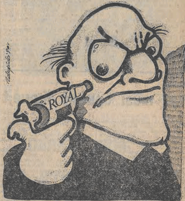
Rys. Piotr Zdrzyński

Nim rozpoczniemy szczegółową relację naszego wysłannika do Gdańska przypomnijmy, że w piątek na pierwszej stronie „DL” zamieściliśmy korespondencję red. Grażyny Murawskiej, która informowała o ujawnieniu przemytu spirytusu „Royal” w ilości 15 120 litrów. Alkohół wwożony nielegalnie do kraju kosztował za granicą 60 tys. dolarów. Jego wartość w Polsce wynosił ponad miliard zł, w takiej wysokości nałożono też do na tę kolosalną kontrabandę, a do tego podatek obrotowy ok. 17 miliardów zł.