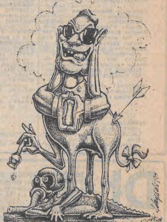
rys. Piotr Żarski

Grabarze, o których mówił Stach, że są na usługach aniołów, wyryli płytki dół (wiem po co). Trumna powędrowała do szpitala, a ja (Stach) uczepiłem się wieka. Nikt na to nie zwrócił uwagi, chyba tylko grabarze pozostali. Systematycznie zanurzałem się w ziemi, ale nie przeszkadzało mi to zbyt. Gdy nie słyszałem już żadnych odgłosów, zastukałem do trumny. Nikt nie odpowiadał, zrozumiałem więc, że Stacha tam nie ma. To moja obecność w dole była pożądana, i moja wiara w wędrówkę dusz.