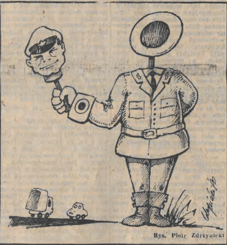
Rys. Piotr Zdrzyński