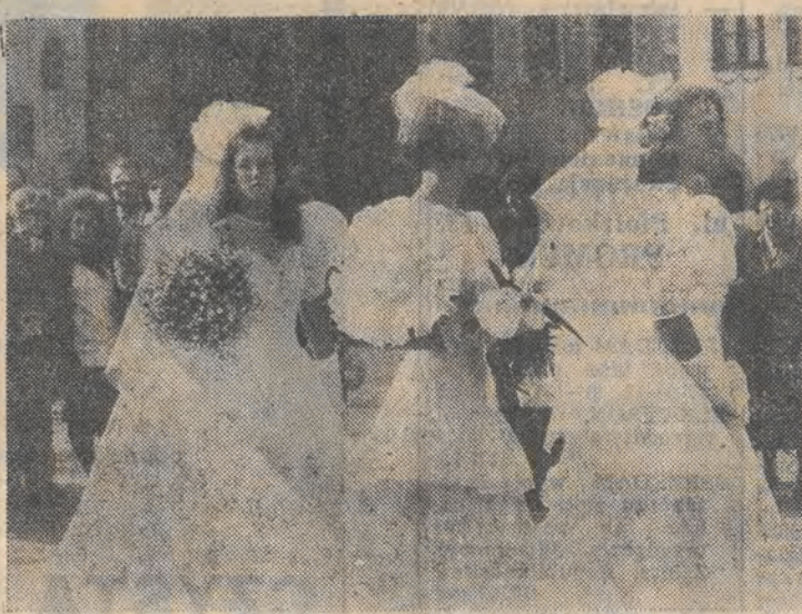
Ślub to jedyną okazją, by pokazać się w kreacji, którą wspomina się przez całe życie...

Odbiór nagród w DSW, Łódź, ul. Limanowskiego 166.