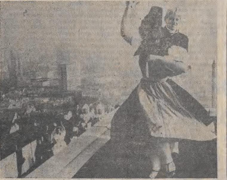
Dla zapalonych tancerzy każde miejsce jest dobre na tańce, nawet dach jednego z wieżowców w Berlinie. Ta para w ludowych strojach z Turyni sżykuje się do konkursu tańca.

Zdaniem PROF. STANISŁAWA PASYKA, twórcy i dyrektora Śląskiego Ośrodka Kardiologii, którego klinika Religi jest częścią szkodową, sto przeprowadzonych w niej transplantacji pozostaje w minimalnym stosunku do potrzeb. Trudną do pokonania przeszkodą w zwiększeniu liczby zabiegów — do czego klinika jest w pełni przygotowana kadrowo i technicznie — jest brak w Polsce systemu stałej informacji ośrodków transplantacji i możliwości pozyskania narządów niezbędnych do przeszczepu. I druga kwestia — kardiologia, a szczególnie kardiologia są dzisiaj najbardziej kosztownymi dziedzinami medycyny. Wprawdzie Śląski Ośrodek Kardiologii sam podejmuje wiele inicjatyw, znajdując sponatorów w kraju i za granicą, niemniej bez finansowego wsparcia budżetu centralnego nie może nie tylko rozwinąć, ale nawet kontynuować w dotychczasowych rozmiarach swego programu transplantacji.