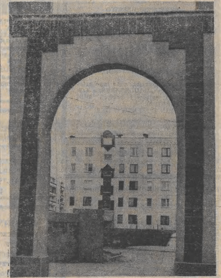
Radogoszcz.