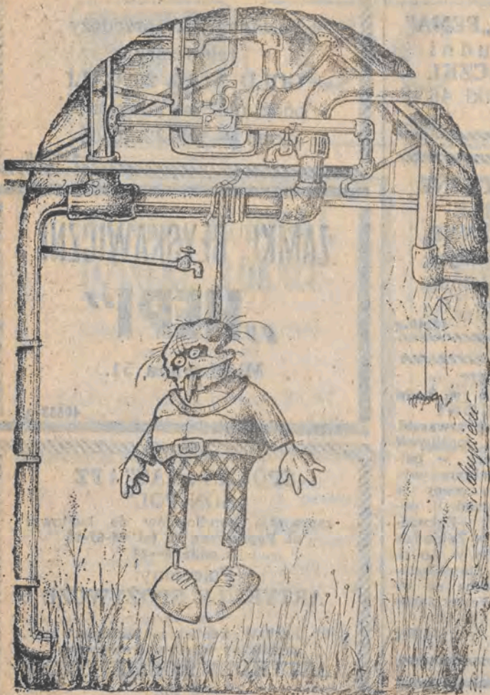
Rys. Piotr Zdrzyński