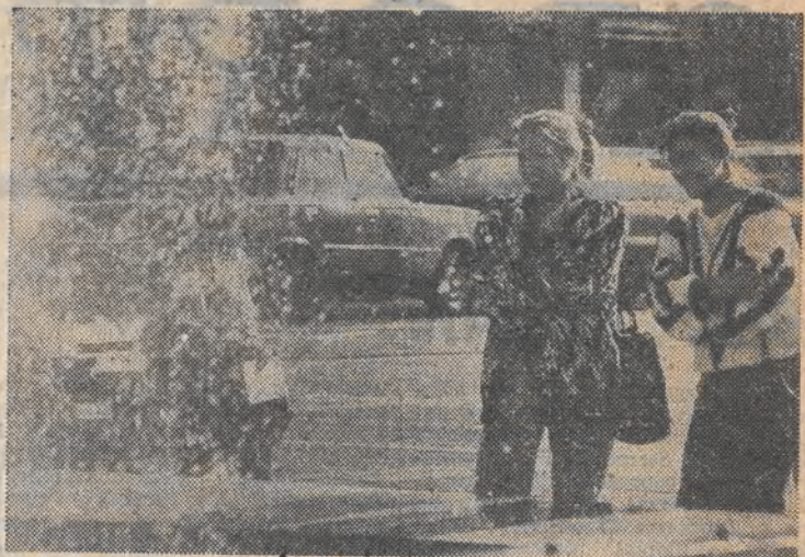
Trochę słońca jesienią.