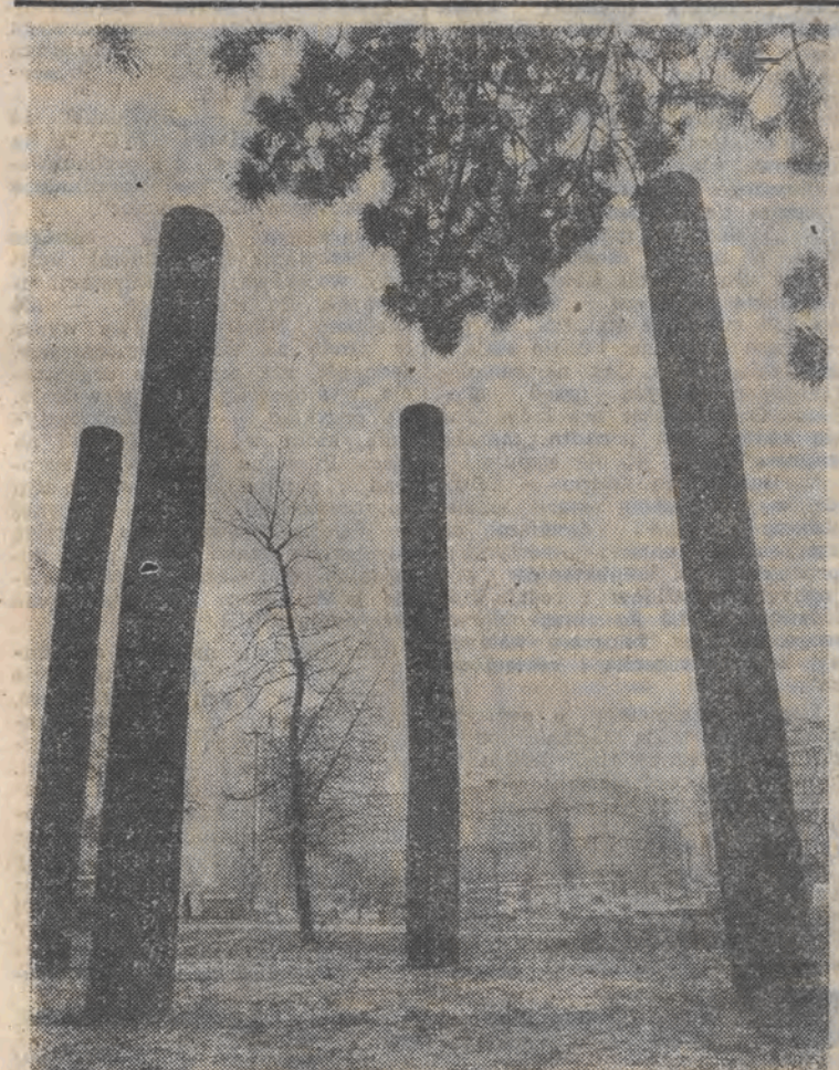
U zbiegu al. Mickiewicza i Kościuszki stoją cztery słupy, o które pytają nas czytelnicy. Odpowiadamy: są one pozostałością „Konstrukcji w Proscie”, akcji artystycznej jaka miała miejsce w Łodzi w zeszłym miesiącu.