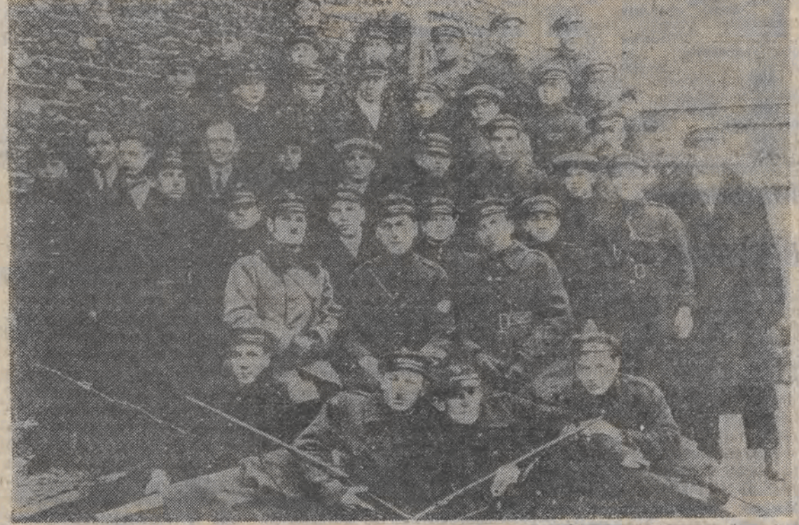
Peowiaci — uczestnicy akcji rozbrajania Niemców na Bałutach 11 listopada 1918 roku.