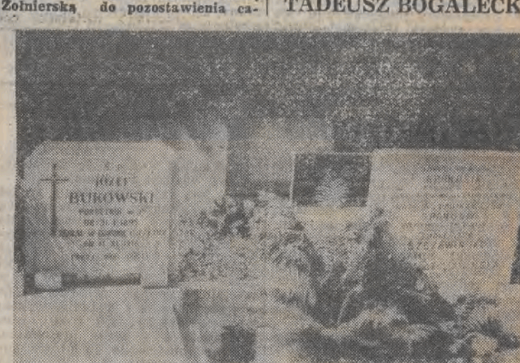
Stary Cmentarz katolicki w Łodzi przy ul. Ogrodowej. Kwatera Polaków — ofiar starć z żołnierzami niemieckimi w Łodzi 11 listopada 1918 roku.