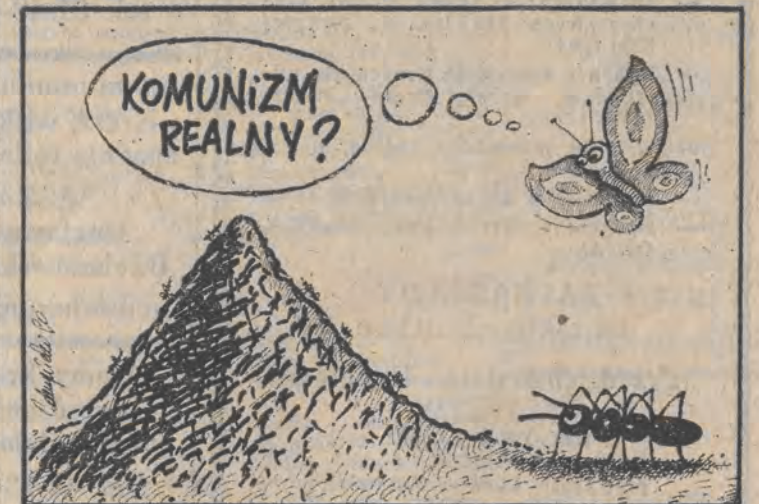
Rys. Piotr Zdrzyński

Kongregacja Wyznań Aleksandrów w Łodzi zaprasza 19 listopada o godz. 16.30 do synagogi przy ul. Rewolucji 1905 r. nr 28 na spotkanie z żydowską muzyką religijną. W programie — pieśni i hymny na sobotę i święta.