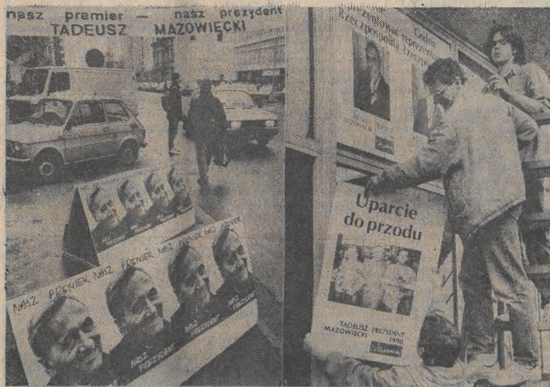
Plakaty wyborcze Tadeusza Mazowieckiego na ulicach Łodzi.