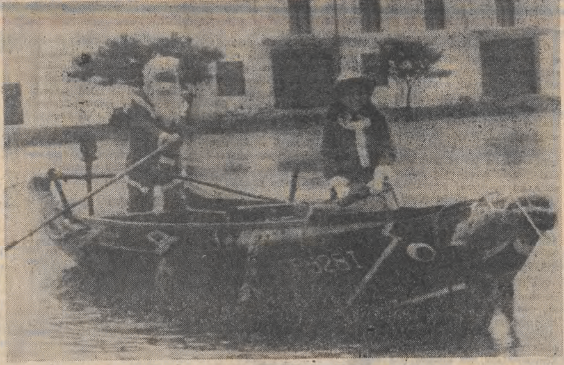
W Singapurze wcześniej, bo już na początku listopada, obchodzony jest festiwal na cześć świętego Mikołaja. Ten Mikołaj zamiast saniami, przypłynął łodzią...