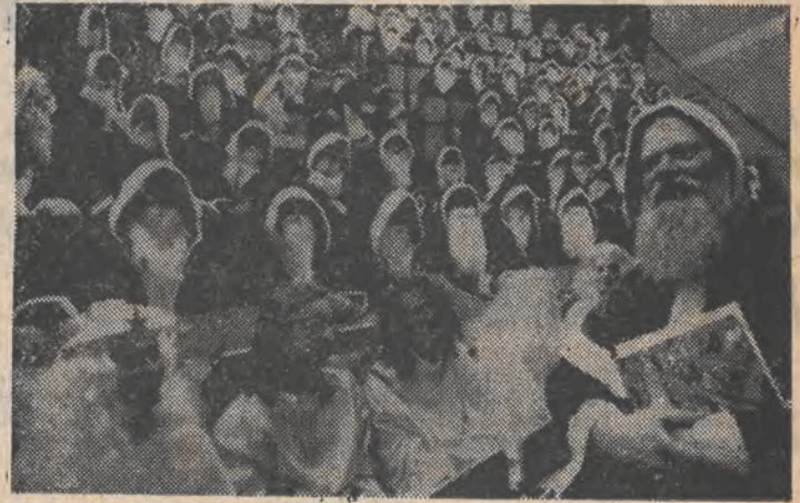
Mikołaje już się szkoła.