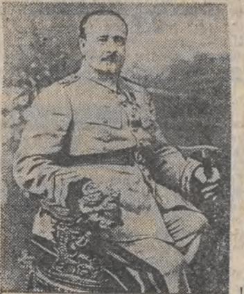
Gen. Józef Haller. 1934 r.

JÓZEF HALLER (1873–1960). Działacz polskich organizacji społecznych i paraimilitarnych w zaborze austriackim, generał broni, polityk.