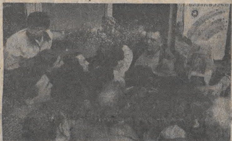
Mimo interwencyjnych zakupów za granicą, tak kupuje się papierozy w stolicy Gruzji, Tbilisi.