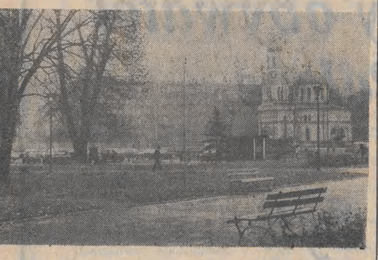
Jesienny pejzaż.

Schronisko dla zwierząt, którym zarządza Towarzystwo Opieki nad Zwierzętami zmieni właściciela. Tym razem będzie to właściciel prywatny. Urząd Miasta, który finansuje działalność schroniska, postanowił je sprzedać. Przyszły właściciel zapewni opiekę znalezionej i bezdomnym zwierzętom, poprowadzi dla nich hotel, do jego obowiązków będzie także należało sprzątanie padliny z ulic. (BAMak)