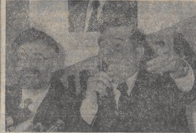
L. Wałęsa podczas konferencji prasowej.