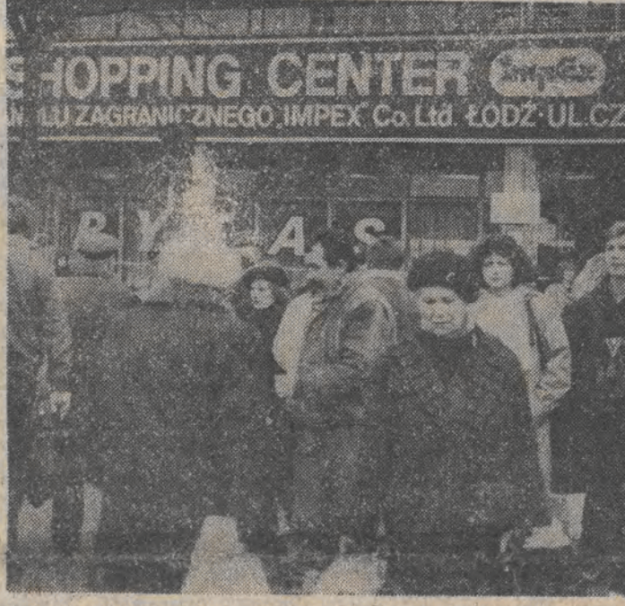
Rozpoczęły się przedświąteczne zakupy.