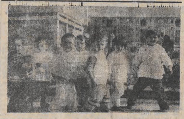
Nieczęsto jest okazja, by zobaczyć zdjęcie z codziennego życia w Albanii. Ale, jak widać, maluchy na całym świecie zachowują się podobnie jak te przedszkolaki na spacerze po ulicy w Lushnje.

Jakkolwiek większość krajów europejskich surowo ogranicza możliwość posiadania broni, stosunkowo łatwo nabywa się ją na czarnym rynku — stwierdza Agencja AP.