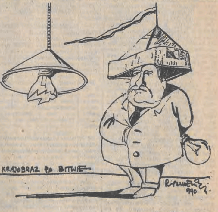
Rys. K. Rynkiewicz

Tkwil pod ścianą taki pstryczek, Mały pstryczek, elektryczek. Jak ten pstryczek robi pstryki! To się widno robi w mig.