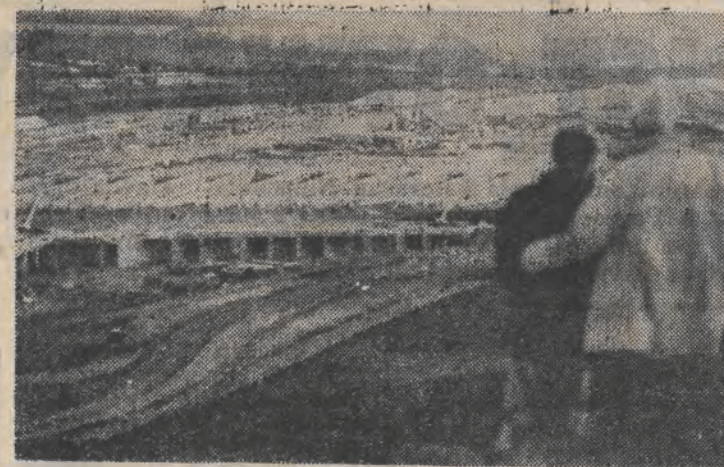
Brytyjczycy żywo interesują się przebiegiem prac przy budowie tunelu pod kanałem La Manche, który — jak mówią — będzie pierwszym lądowym połączeniem między Francją i Anglią od czasów... epoki lodowcowej. Tak wygląda obecnie plac budowy terminalu tunelu po stronie brytyjskiej w Folkestone.