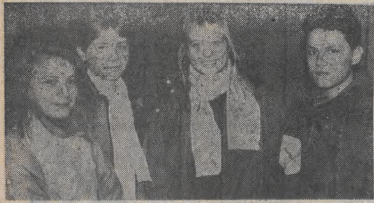
Przedstawiciele klasy VIIb ze szkoły nr 28.