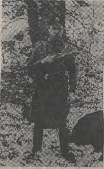
Por. J. Piwnik „Ponury”. Grudzień 1943 r.

ULICA MJR. JANA PIWNIA „PONUREGO” (projektowana ulica biegnąca od ul. Stanisława Przybyszewskiego na południe na wysokości numeru 221).