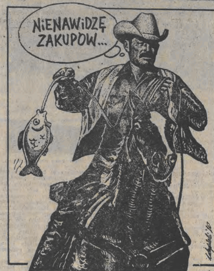
Rys. Piotr Zdrzyński

Zakłady, w których obowiązują 40-godzinny tydzień pracy, zakładki udzielające dodatkowego dnia wolnego od pracy w każdym tygodniu (52 dodatkowe dni wolne od pracy), mogą dzień wolny wyznaczyć na 24 grudnia, ale w tym przypadku wszystkie pozostałe dni robocze tygodnia będą dniami pracy.