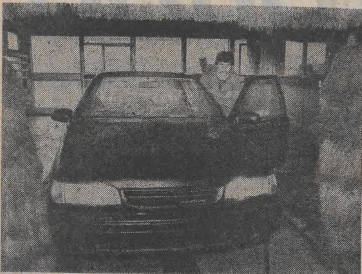
Wczoraj przyjechała z Korei Południowej do łódzkiego „Polmozytu” pierwsza partia samochodów Hyundai. Są myte i przechodzą przeglądy zerowe, a klienci odbiorą je w pierwszych dniach po świętach.