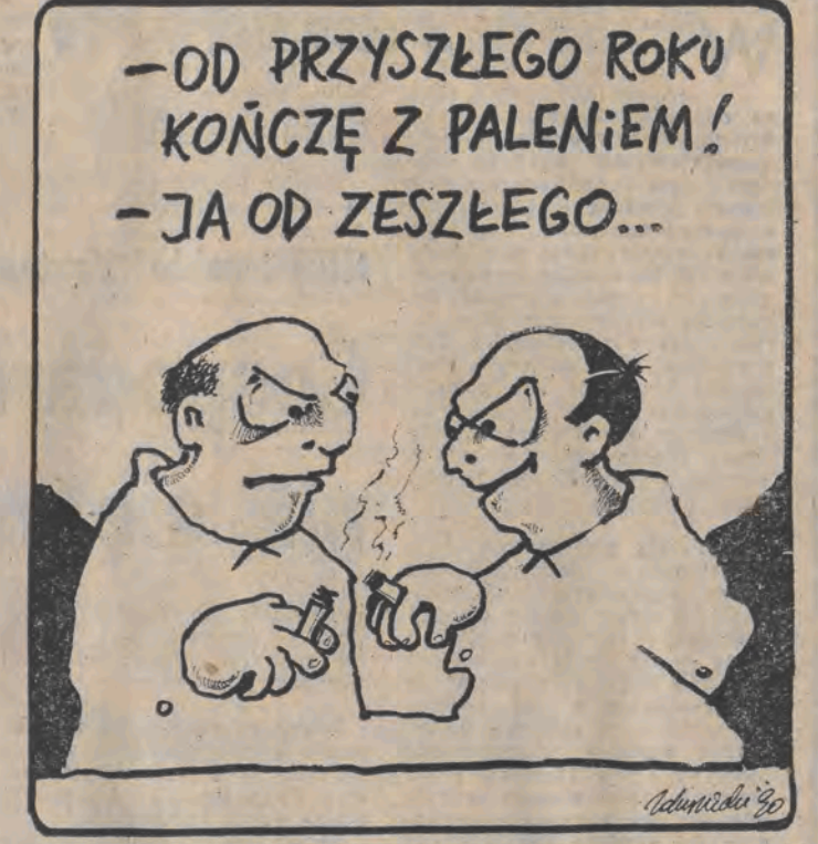
kys. Piotr Zdrzyński

Czytelnie wypełnione kupony prosimy kierować pod adresem „DZIENNIK ŁÓDZKI” 90-113 Łódź, ul. Sienkiewicza 9 z dopiskiem na kopercie lub karcie pocztowej: „Plebiscyt”. Można także składać kupony w redakcyjnej skrytce ul. mieszczonej w portierni.