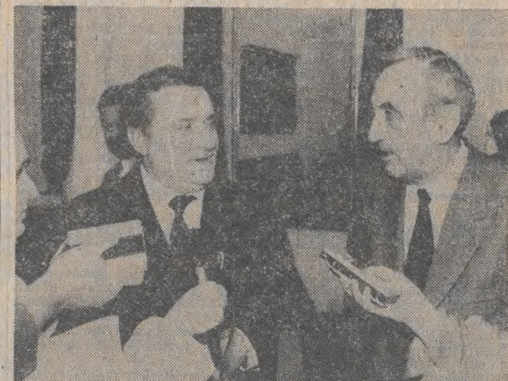
Na zdjęciu: prezydent Lech Wałęsa i premier Tadeusz Mazowiecki, w chwilę po zakończeniu spotkania, w rozmowie z dziennikarzami.