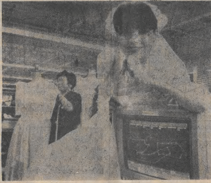
Tę elegancką suknię ślubną zaprojektował i skroił komputer. Rocznie amerykańska firma Angelo wykonuje tym sposobem 300 tys. ślubnych strojów.

Ponad 200 milionów par obuwia sprowadzi w tym roku Francja z zagranicy. Na czele listy zagranicznych dostawców znajdują się przemysły obuwnicze Włoch, które np. w roku 1988 dostarczyły Francji 63 miliony par butów, przeważnie luksusowych gatunków oraz Chin (51 mln par).