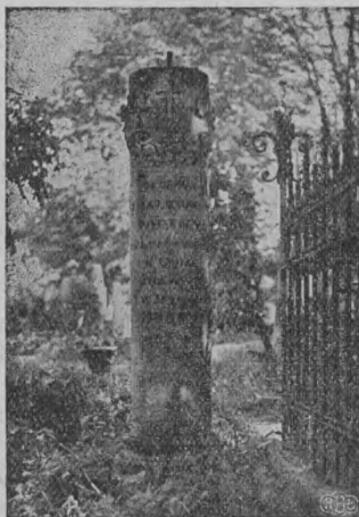
Pomnik nad mogiłą