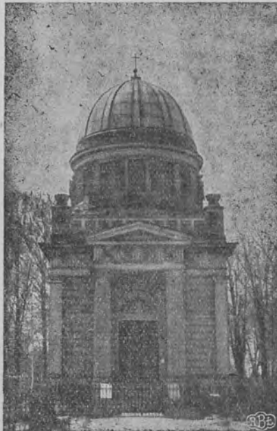
Mauzoleum Heintzlów na Starym Cmentarzu Katolickim w Łodzi.