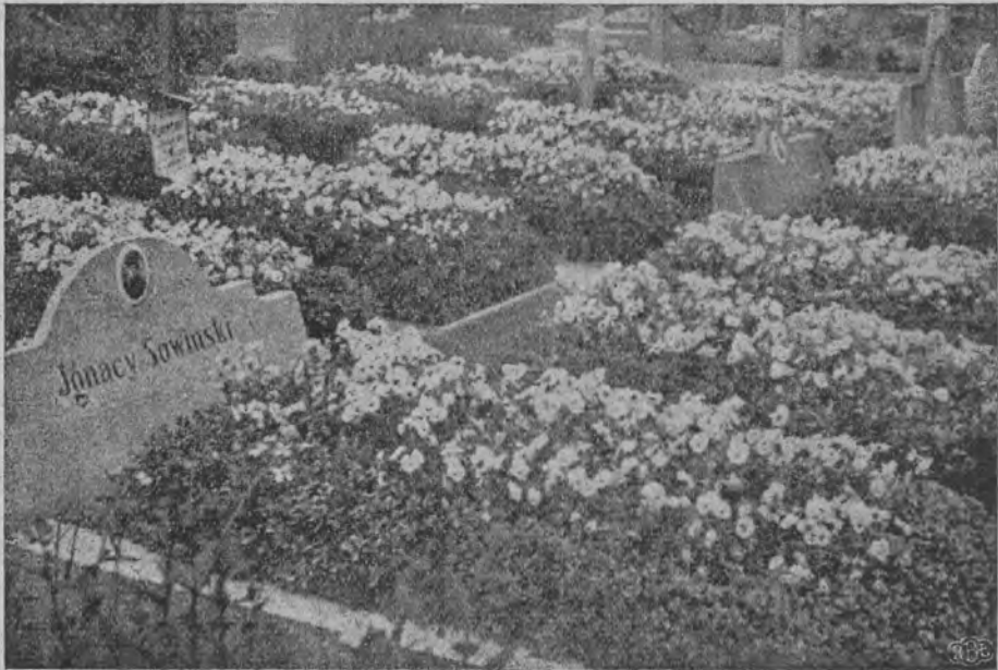
Kwaterna mogił poległych od zdradzieckiej kuli łodzian w okresie rewolucji w latach 1905—1909.

Tutaj, na Starym Cmentarzu Katolickim znajduje się dokument walk bratobójczych w okresie rewolucji lat 1905—1907. Są nim mogiły tych, którzy zginęli od kuli skrytobójczej. Mogiły te zajmują oddzielną kwaterę po stronie lewej cmentarza od alei głównej za kapliczką. Na mogiłach czytamy nazwiska: