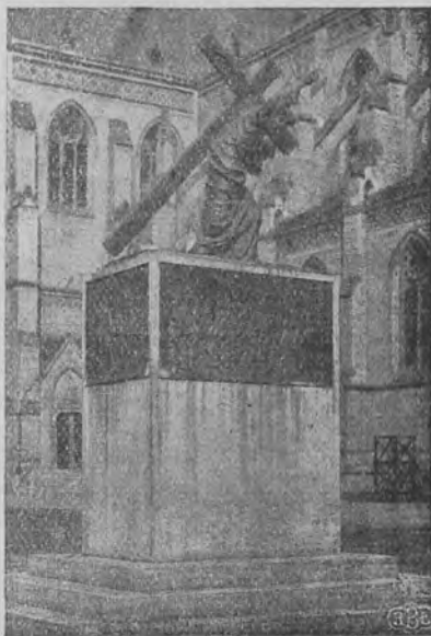
Pomnik wystawiony ku uczczeniu pamięci bohaterskiego kapłana ś. p. ks. Ignacego Skorupki. Pomnik przedstawia Pana Jezusa, dźwigającego krzyż na Golgotę. Boki cokołu, ozdobne w płaskorzeźby, przedstawiają fragmenty bitwy pod Ossowem.