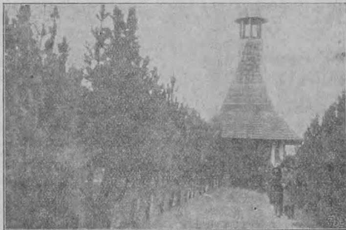
Fragment cmentarza wojennego rosyjsko-niemieckiego pod Rzgowem.