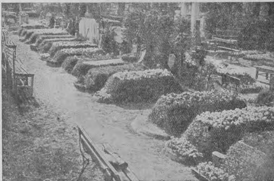
§ 3 Kwaterna grobów policjantów na Starym Cmentarzu Katolickim w Łodzi.