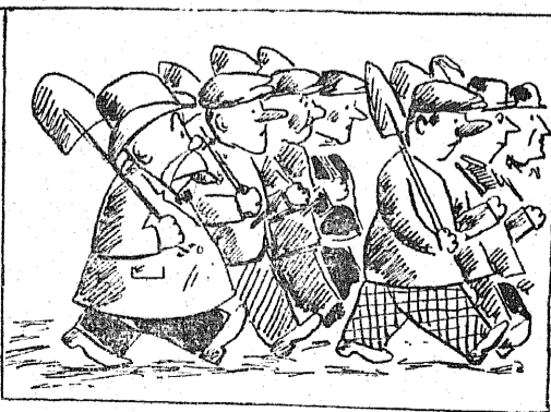
A po robocie cała brygada Wraca w paradzie do domu rada. Każdy z łopatą razem w szeregu, Krupka z cygarem rżnie pierwszy z brzęgu.