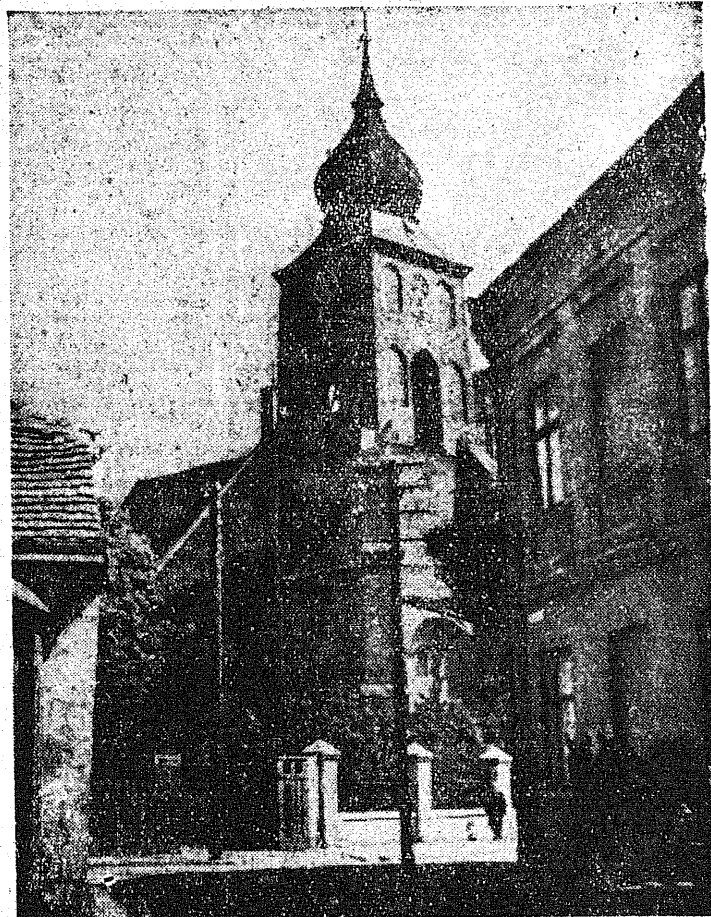
Fara Sieradzka wzniesiona w epoce Kazimierzowskiej. (Patrz artykuł „Prastary gród Sieradzki” na str. 4-ej)