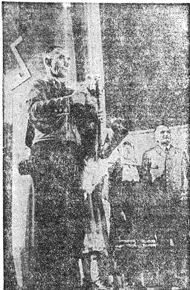
Ze zjazdu Polaków autochtonów Ziemi Odzyskanych. Kobziarz w lubuskim stroju ludowym