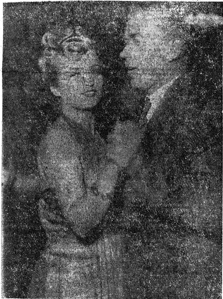
Oto jedna z pięknych fryzur, nagrodzonych na ogólnopolskim konkursie fryzjerskim w Łodzi