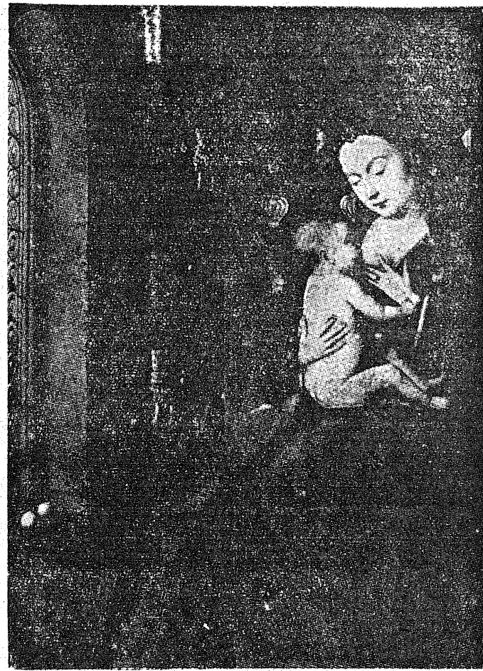
Słynny obraz van Eyck'a „Madonna di Lucea”.

Odpowiadając na pytanie w sprawie zachodnich granic Polski Schumacher w sposób zdecydowany powołał się na stuttgartską mowę min. Byrnesa.