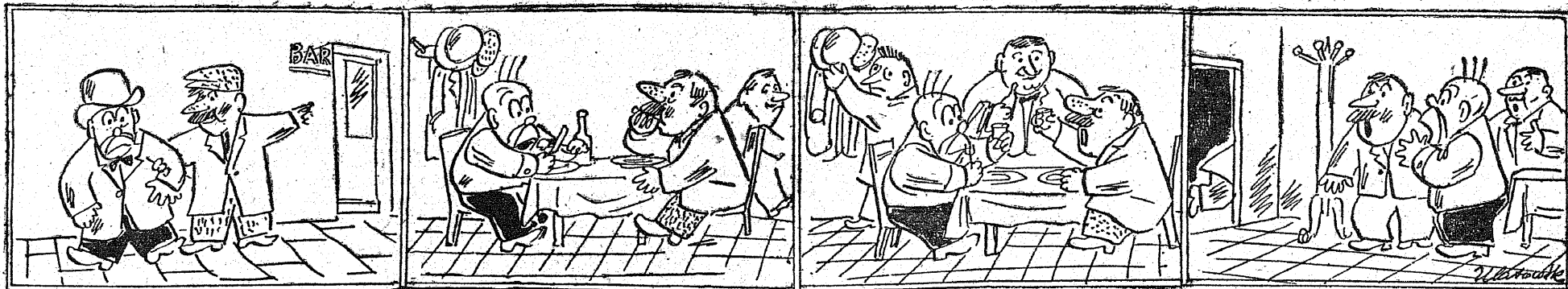
Krupka dostał już mieszkanie, chce więc zrobić oblewanie.