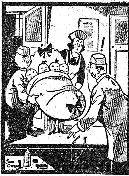
(rys. z angielskiego pisma „Daily Mirror”)

Urodziły się czworaczki, Cztery małe niemowlaczki. Dwóch chłopczyków, panny dwie. Każde z nich się głośno drze,