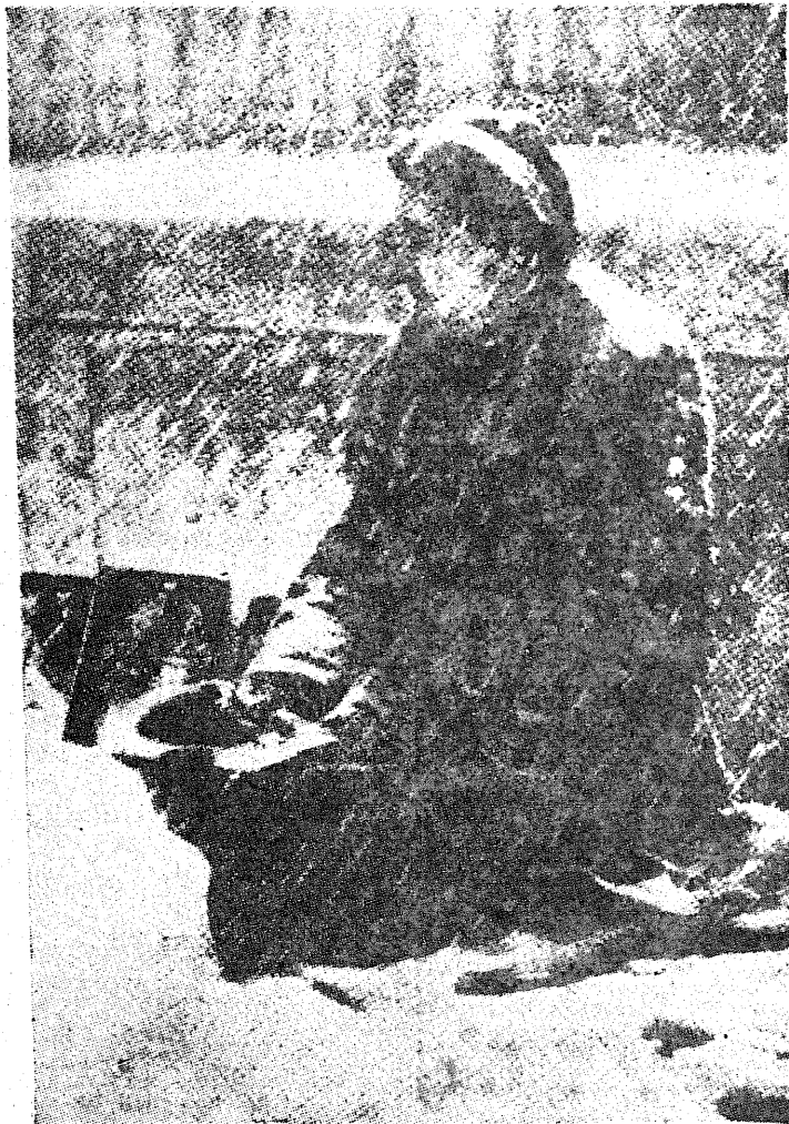
Nie tylko w Łodzi mamy zadymkę śnieżną. W Londynie zapanała zima w całej pełni. Na jednej z ulic Londynu biedna kobiecinka czeka na przechodnia, który wrzuciłby jej monetę do kapelusza, albo nabył sprzedawany przez nią obrazek.