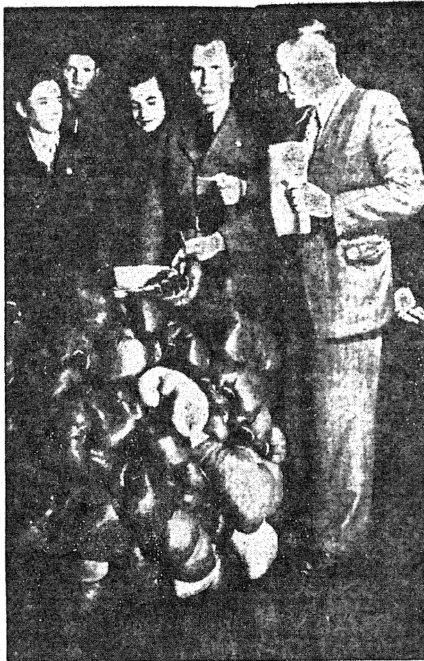
W Polskiej YMCA w Warszawie nastąpił rozdział 4 ty. sięcy par rękawic bokserskich dla sportowców polskich.

głodują liczne narody Europy i Azji. Zdaniem dziennika, niszczenie nadmiaru kartofli może być pierwszym krokiem ku realizacji polityki niszczenia wszelkiej innej „zbędnej żywności”, ażeby utrzymać wysokie ceny produktów rolnych.