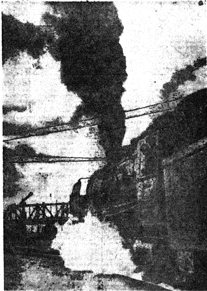
Semafor otwarty. Pociąg pośpieszny rusza w drogę.

Następna sprawa, która rozpatrzy kongres, będzie ratyfikacja przez Stany Zjednoczone traktatów pokojowych z Włochami, Węgrami, Bułgarią i Rumunią.