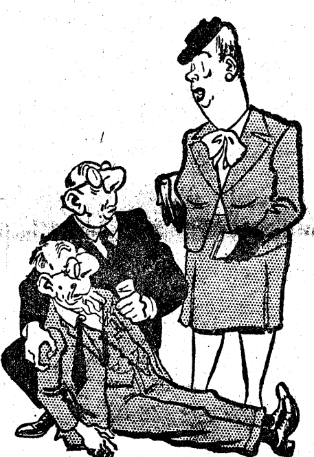
(rys. z angielskiego pisma „Daily Mail”)

Jakiś facet Przerazony Na ulicy Padł zemdlony.