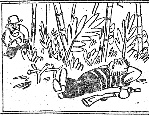
Potem leżał na ziemi syty. Zasnął mocno jak zabity.