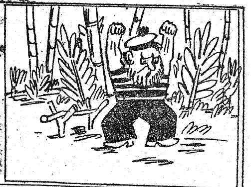
Przebudzenie marynarza Nie jest miłe. (Znać to z twarzy!)