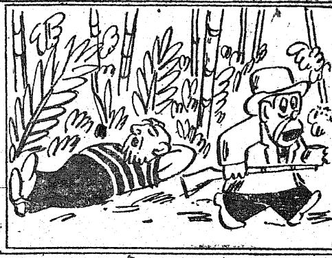
Krupka podszeł do niecnoty, Zabrał strzelbę oraz złoto.