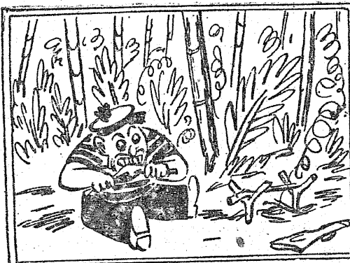
Rabuś z wielkiej żarłoczności Mięso zjadł i obgryzł kości.