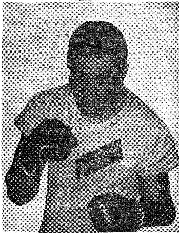
Marzeniem każdego boksera jest osiągnięcie sławy mistrza świata Joe Louisa.

Będą one płatne przyszłym eksportem niemieckim. Dotychczas-