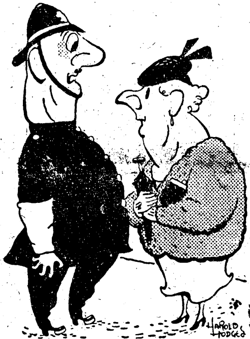
rys: z pisma ang. „Daily Mail”

Do policjanta Wzburzona nieco Podbierga dama: — „Mą cześć kobieca