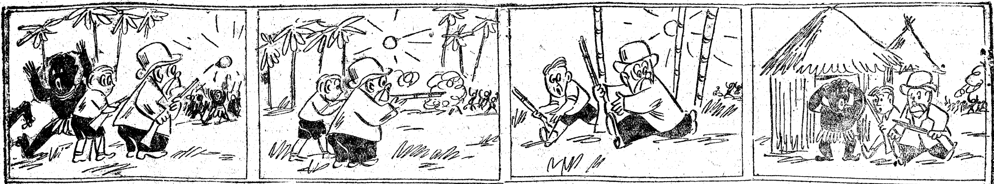
Natarli murzyni wściekły, A pigmeje w las uciekli,