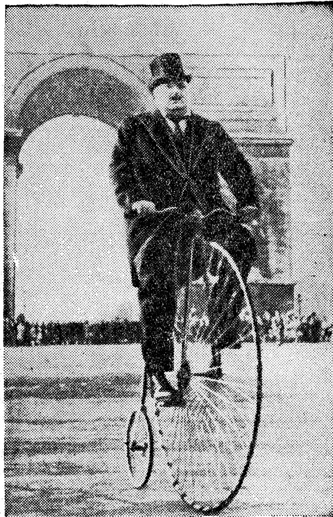
Mniej więcej przed pół wiekiem tak wyglądał rowerzysta udający się na spacer za miasto

Omawiając jego przemówienia w Londynie, prasa donosi jednocześnie o ostrych atakach na Wallace'a w senacie amerykańskim. Reakcyjni senatorowie oskarżają Wallace'a o zdradę interesów amerykańskich i działalność na szkodę państwa.