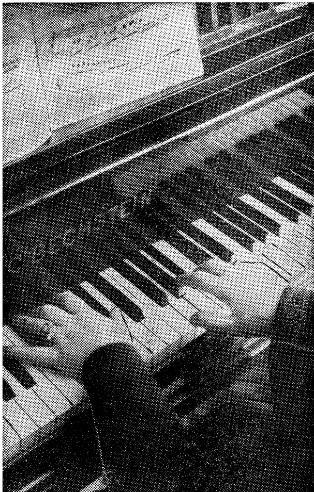
Dobra technika to nie wszystko. Oryginalny „Bechstein“ gwarantuje piękny, czysty ton.

Chwilowo sytuacja polityczna jest wielce zagmatwana. Poszczególne stronnictwa zdają się unikać odpowiedzialności w oczekiwaniu na wybory powszechne.