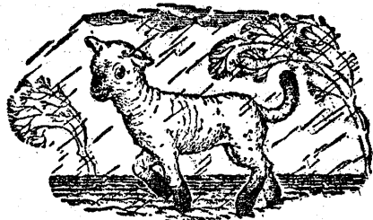
Rys. z pisma ang. „News Chronicle“)

Smutna dola Jest barana, Bo deszcz pada Dziś od rana. Mokro z dołu I od góry! Właśnie wczoraj Aż do skóry