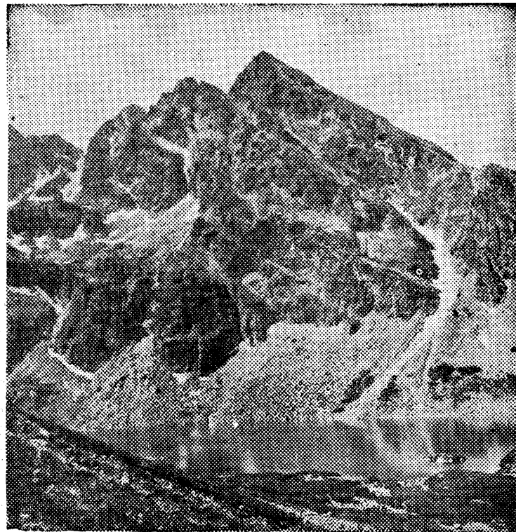
Tatry — to idealne tereny turystyczne — Na fotografii: Kościelec i Czarny Staw Gąsienicowy.