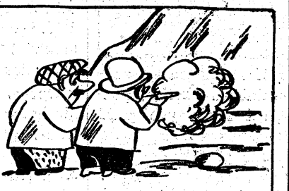
"Nie ma rady - Flutek woła - Tylko zabić trza potwora!"