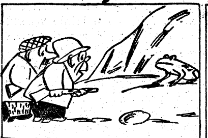
Do syreny swęj się dostać. Gdy jej straszna strzeże postać.