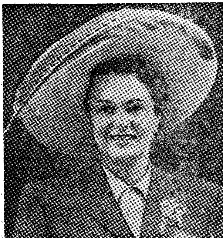
Moda stale się zmienia. Obecnie w Ameryce lansowane są kapelusze z dużym rodmem i piórami.

Związek Zawodowy robotników francuskiego przemysłu gumowego komunikuje dziś o zapowiedzianym na jutro jednodniowym strajku 20.000 robotników we wszystkich fabrykach gumowych Francji. Robotnicy przemysłu gumowego domagają się wprowadzenia premii pro-