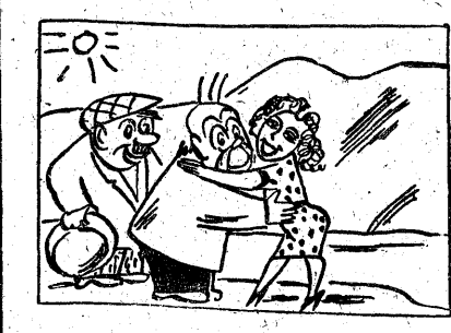
Dama z Krupką w czulej scenie. Pocałunek. Stop! Zbliżenie.