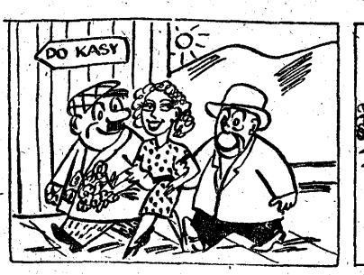
Koniec filmu państwo macie. Kasjer forszę wnet wypłaci.