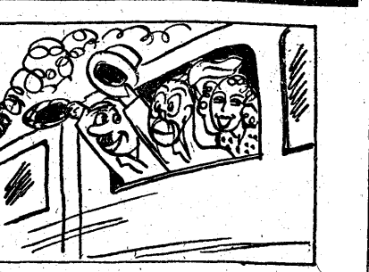
Mknij do Łodzi cała grupka: Miss „syrena”. Flutek, Krupka.