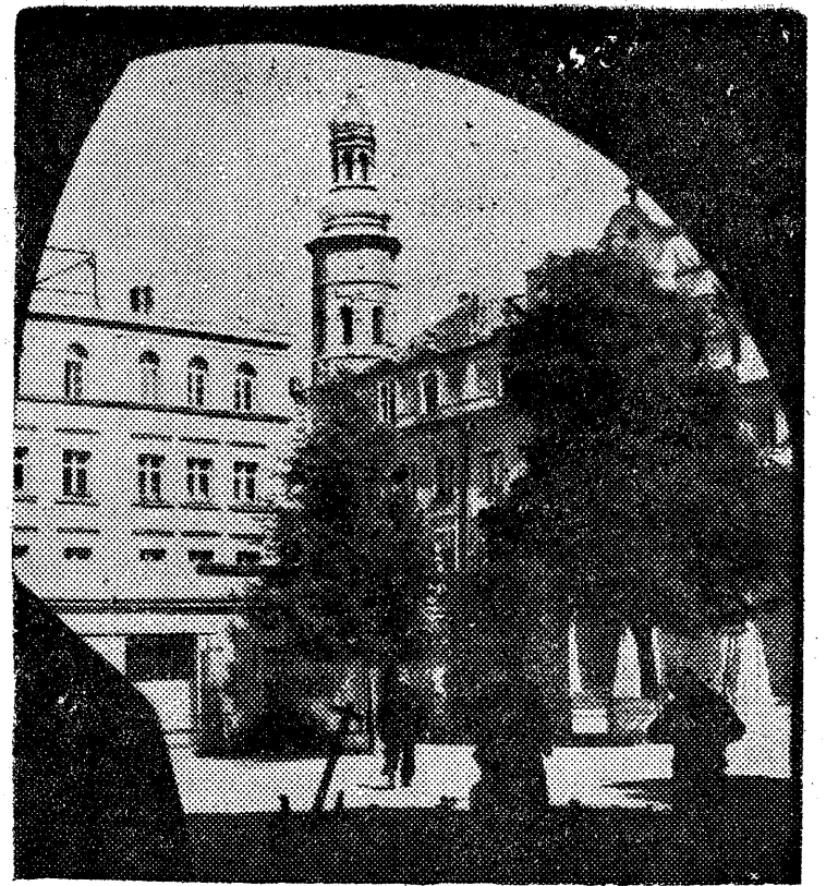
Fragment rynku w Jeleniej Górze.