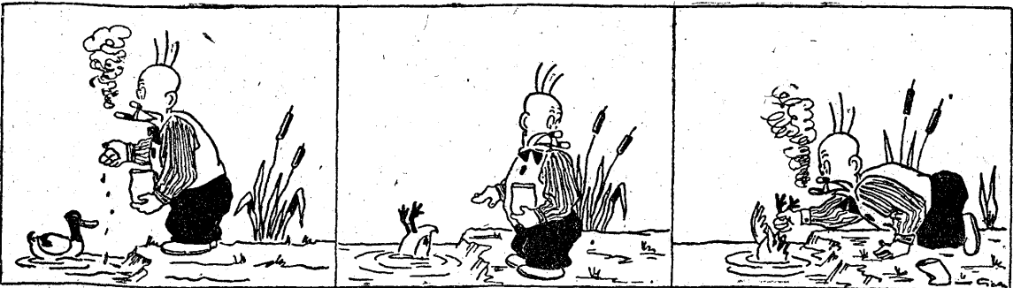
Krupka kaczki lubi zjadać. Ale kłopot ma nielada

„Znowu załzał się jak świnia! — mruczy gospodyni — dość głośno, by