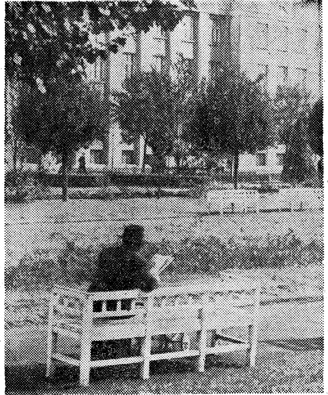
Ostatnie ciepłe dni. Szkoda siedzieć w mieszkaniu — o wiele przyjemniej jest na skwerze

Wzmianka o tym liście zamieściła również agencja Reutersa, przypominając stanowisko władz brytyjskich w Niemczech, potwierdzone ostatnio przez rzecznika Foreign Office, jakoby Polacy westfalscy byli obywatelami niemieckimi, wobec czego władze brytyjskie przeciwstawiają się ich powrotowi do Polski.