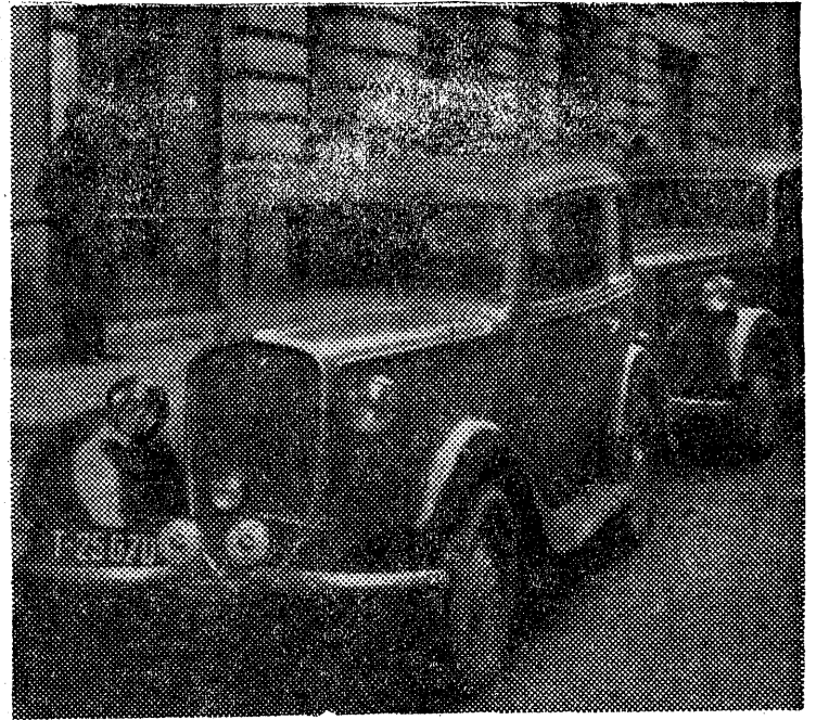
W Łodzi z każdym miesiącem zwiększa się ilość taksówek